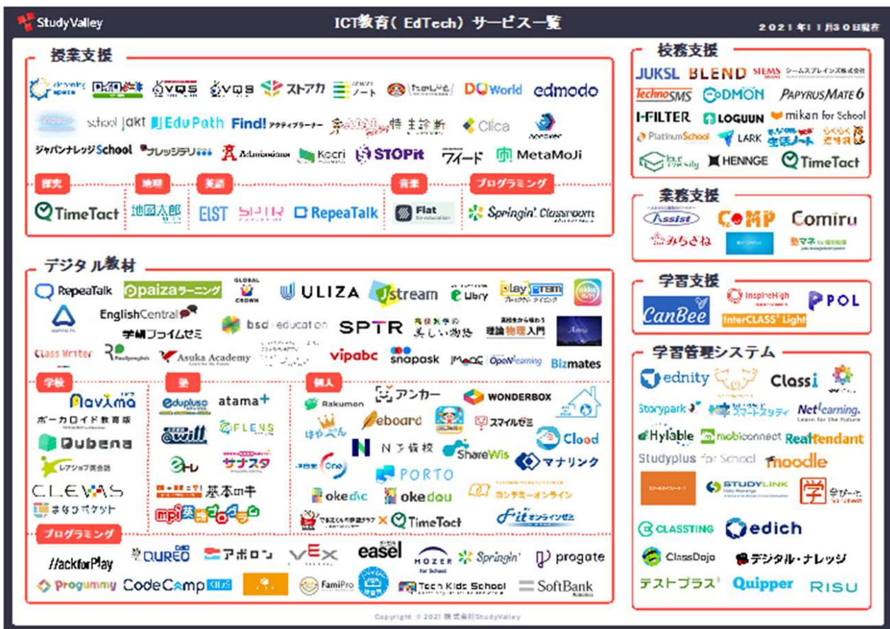
【2022年版】ICT教育（EdTech）サービスカオスマップ