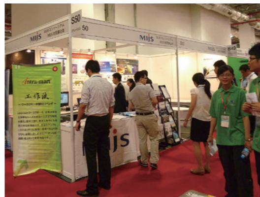
(以上信息来源于 2012 年 10 月的采访)

产品市场推广委员会以促进软件产品、IT 服务的利用,加强销售,提高经营能力和市场营销能力为目的委员会。该委员会成员除了实施共同的产品宣传之外,还彼此举办产品学习会、宣传学习会及共同协办的新人培训等,开展各种旨在提高企业能力的活动。这些活动的成果,有助于增进 MIJS 会员与海外各家公司的合作。